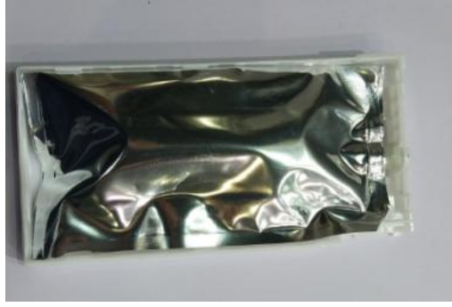
Vakumlu boya torbası